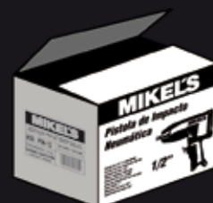
CAJA COLECTIVA 47 cm x 24 cm x 33 cm