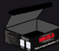
CAJA A COLOR 22.7 cm x 22.2 cm x 7.5 cm