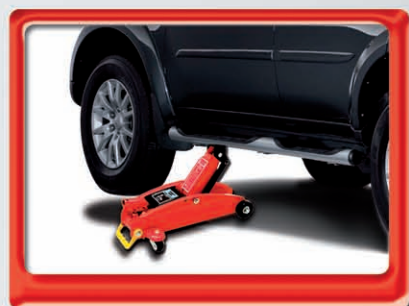
Altura Máxima 350 mm