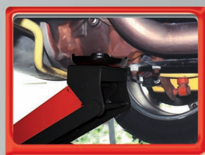
Plato de gran superficie para una fácil colocación