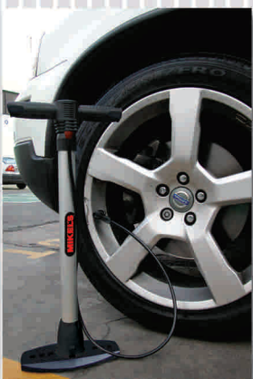
INFLE SUS NEUMÁTICOS EN CUALQUIER EMERGENCIA