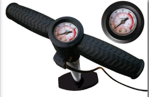
MANÓMETRO SOBRE EL MANGO