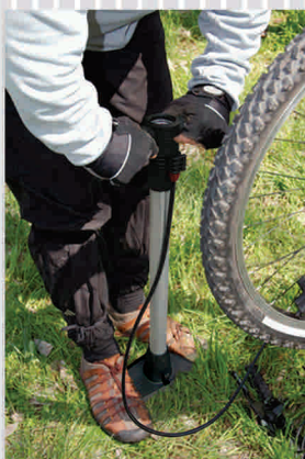
ESPECIAL PARA UTILIZARLA EN CUALQUIER LUGAR

Para Ciclistas cuyo Peso es superior a 82Kg, infle las llantas a su capacidad Máxima indicada en la parte lateral de la llanta. Para Ciclistas cuyo Peso es inferior a 50Kg, infle las llantas a su capacidad Mínima, indicada en la parte lateral de la llanta.