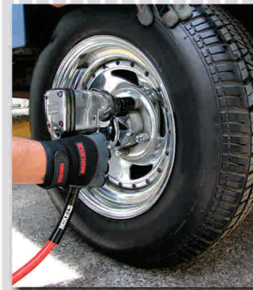
Ideal para herramienta neumática