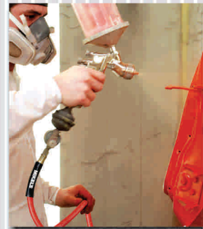
Ideal para equipos de aplicación de pintura