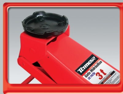
Plato de gran superficie para una fácil colocación