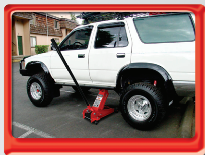
Incluye palanca de 1 m de largo