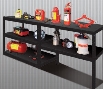
FORMATO TIPO BARRA