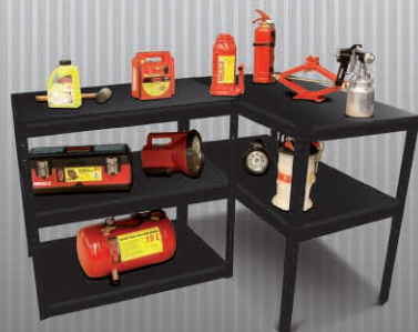
FORMATO TIPO ESCRITORIO